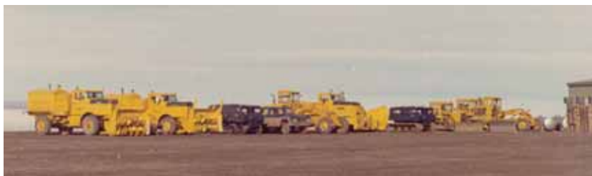
Maskinparade ved verdens ende

nen gik gennem Thule Air Base, at alle køretøjer var amerikanske, at forsyningerne blev fløjet ind til Station Nord med amerikanske militærfly, hvorfor radiostationen var forsynet med amerikanske lyttefrekvenser, hvorfor alle nødforsyninger var af amerikansk oprindelse. Vi var jo danske! Men den stille undren kan også udløse spørgsmål. Hvorfor rydder udendørsfolkene landingsbanen i døgndrift, når den alligevel flyger til, hvorfor ikke vente til vejret bliver bedre, når vi ved, at det næste fly, vi forventer at ankomme til Nord, er anmeldt til landing om 3 uger. Har den danske stat virkelig så mange