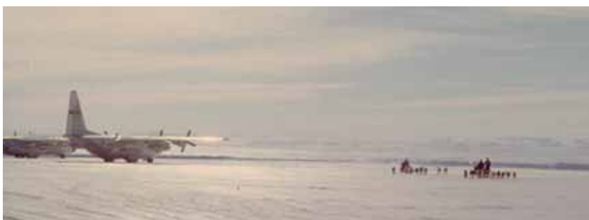
Transportmidler i nordgrønland

5. Den danske forbindelsesofficer på Thule Air Base var af den opfattelse, at vi som civilt personel var underlagt basepersonellets begrænsede bevægelsesfrihed i Thuleområdet.